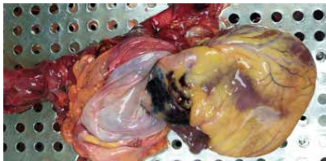
Obr. 1. Hematoma v oblasti ascendentní aorty. / Fig.1. Hematoma of ascending aorta.

V oblasti ascendentní aorty prosvítal hematoma tmavě fialové barvy (obr. 1). Po rozstřížení aorty byla ve vzdálenosti 2,5 cm nad aortální chlopní nalezena trhlina cévní výstelky vzhledu obráceného písmene „Z“ o max. rozměru 1,5 cm. V místě trhliny byl přítomen čerstvý intramurální hematoma, který ložiskově dosahoval tloušťky až 1,5 cm (obr. 2). Hematoma se propagoval jednak do oblouku aorty, včetně odstupů krčních tepen, zároveň se šířil i retrogradně až ke kořeni aorty a postihoval i počáteční úseky levé i pra-