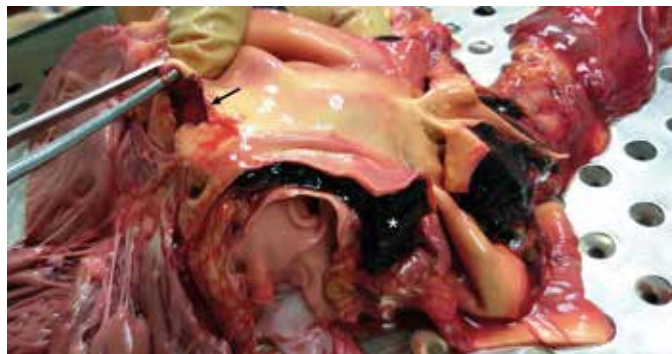
Obr. 2. Trhlina v cévní stěně (šipka) a intramurální hematoma (hvězdička). / Fig.2. Tear within a vessel wall (arrow) and intramural hematoma (star).